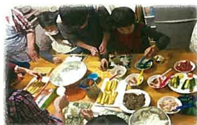
前回養成研修の様子