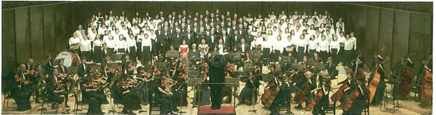
2018年12月2日 渋谷区文化総合センター大和田さくらホール

今年はLINE CUBE SHIBUYAとして新しく生まれ変わった渋谷公会堂の柿落とし公演として開催いたします。 令和と共にスタートするこの公演が、多くの方々に感動を与え、明日への希望に繋がることを願っています。