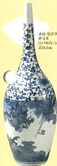
染付 花唐草雲鳳文 瓶 伊万里 江戸時代(18世紀前半) 高26.6cm