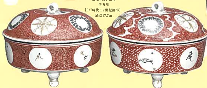
色絵 丸文 蓋物 伊万里 江戸時代(17世紀後半) 通高17.7cm