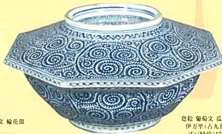
染付 蘭唐草文 八角蓋物 伊万里 江戸時代(19世紀) 通高13.2cm