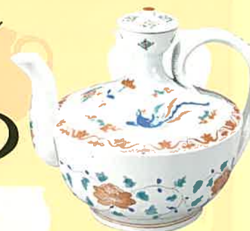
色絵 鳳凰花唐草文 水注 伊万里(栢右衛門様式) 江戸時代(17世紀後半) 通高16.5cm