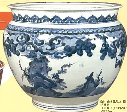
染付 山水鳳凰文 壺 伊万里 江戸時代(17世紀後半) 高27.0cm