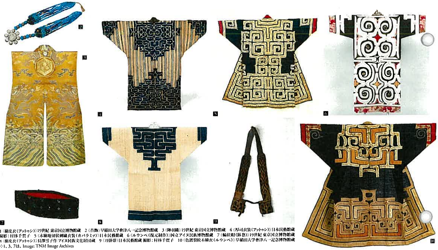
1 樹皮衣(アットゥシ)19世紀 東京国立博物館蔵 2 首飾 早稲田大学會津八一記念博物館蔵 3 陣羽織 19世紀 東京国立博物館蔵 4 厚巾衣装(アットゥシ)日本民族館蔵 撮影: 村林千賀子 5 本綿地切伏刺繍衣装(カバラミア)日本民族館蔵 6 ルウンペ(複元制作) 19世紀アイヌ民族博物館蔵 7 輪状袖(鉢巻)19世紀 東京国立博物館蔵 8 樹皮衣(アットゥシ) 眞澤雪子作 アイヌ民族文化財団蔵 9 刀掛帯 日本民族館蔵 撮影: 村林千賀子 10 色置裂紋木綿衣(ルウンペ) 早稲田大学會津八一記念博物館蔵 ©1, 3, 7は、Image: TNM Image Archives

本展が今後も多くの方々にアイヌ民族の文化への関心を高めていただく契機となりますよう、アイヌ民族の服飾文化を紹介いたします。