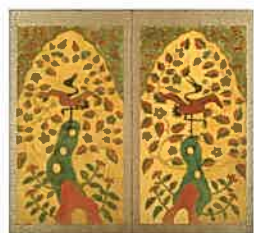
《描更紗鶴岡衛立》大正5(1916)年頃 笛吹市青楓美術館蔵