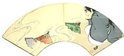
「とうか会」より(合名会社芸神堂)明治40(1907)年、スコット・ジョンソン氏蔵