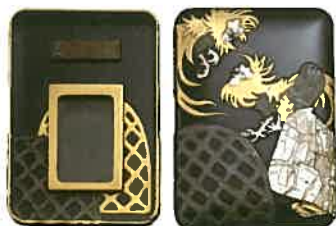
浅井忠(図案)杉林古香(制作)《鶏合蒔絵硯箱》明治39(1906)年、佐倉市立美術館蔵