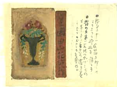
《表紙原画「心之園」(田山花袋著)》大正9(1920)年、個人蔵