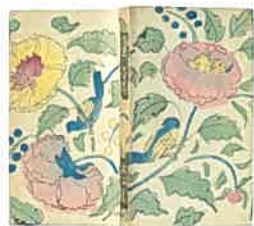
津田青楓(装幀)夏目漱石「道草」(岩波書店)大正8(1919)年13版(初版：大正3年) 山田俊幸氏蔵