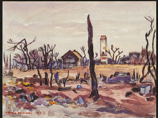
すべて渋谷区立松濤美術館蔵