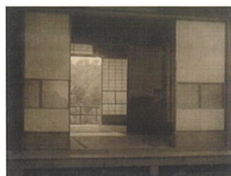
石田喜一郎《夏座敷/Summer Rooms》1925年頃 渋谷区立松濤美術館蔵