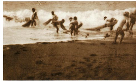
大田黒元雄「作品名不詳〔漁〕」 手製作品集(無題)より 1921年頃