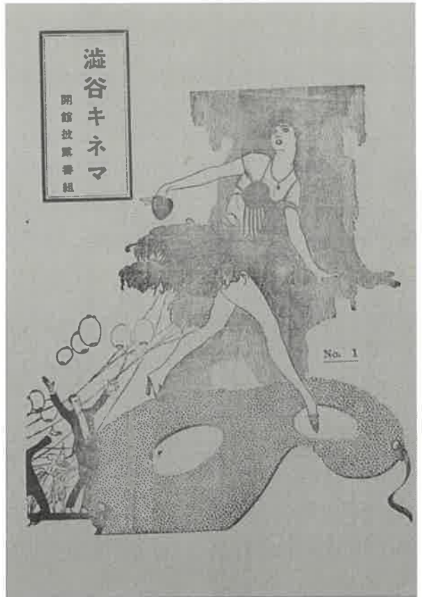
大正14年 渋谷キネマ 開館時のプログラム