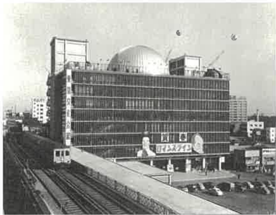
昭和32年 東急文化会館